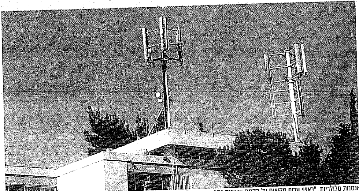
אנטנות סלולריות. "ראשי ערים מקשים על הקמת אנטנות במרחב הציבורי"

גרמן: "החמור מכלל שהתקנות החדשות בגדר הכשרת השרי ויהרסו לחלוטין את ההישגים שהושגו נכה בנושא הסדרת מתקני הגישה"